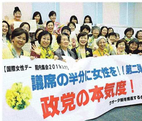
統一地方選挙の女性候補予定者らが、女性議員を増やそうとアピールした =7日、国会内

統一地方選挙では、女性ゼロ議会の約150で選挙がある予定で、女性議員が増えることが期待されています。一方で女性の政治参加には、家庭との両立や、議会が男社会であることなど、壁も指摘されています。